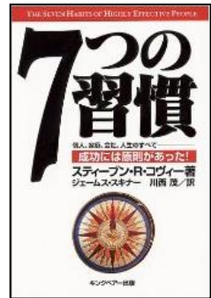
スティーブン・R・コヴィー著 キングベアー出版