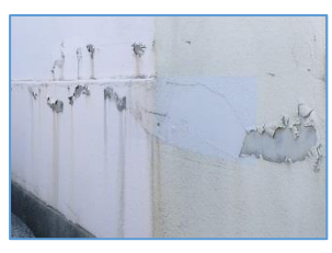
↑ 長年放置されたままの外壁。この状態になると建物に影響がでます

そのまま放置すると、紫外線や雨風にさらされた外壁の塗膜が劣化し、塗装で保護されていない状態の壁がおき出しになります。建物そのものが劣化してしまうのです。 これは屋根や屋上も同じで、塗装しないことで、雨もりの原因となってしまう可能性があります。