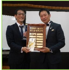
《↑今回石川が受賞しました♪》

こちらは去年からはじまりました新たな社内評価制度に基づく表彰式です。当委員会が経営理念に基づく5つの評価カードを管理しており、そのカードを一年で一番多くもらった方を表彰するというものです。