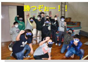
※子どもたちの顔には、個人情報上の関係上、スタンプで加工しております。

「シッポとり」 クラス対抗で、腰に巻いたヒモを多くとったクラスが勝ち進み、最後は私たちPTAのお父さんたちと数名の先生が鬼になり、生徒の腰のヒモをねらい、追いかける