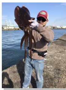
地元・小倉の西港の海にて

偏光グラス(釣りの際にかけるサングラス)をしていて、少し人相がわるくみえる...のはご愛敬(笑)。地元でもこんなに立派なイカが釣れて感動です。そして北九州には北九州のステキな風景があります☆いっしょに釣りに行ってくれる仲間への感謝と、この自然を次の世代にものこしていきたいと感じる春でした。