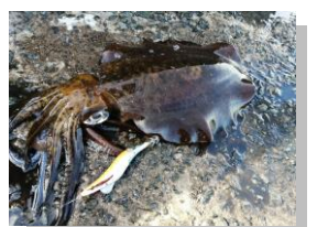
とっても美味しいアオリイカト