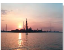
小倉の工場と海、夕陽

偏光グラス(釣りの際にかけるサングラス)をしていて、少し人相がわるくみえる...のはご愛敬(笑)。地元でもこんなに立派なイカが釣れて感動です。そして北九州には北九州のステキな風景があります☆いっしょに釣りに行ってくれる仲間への感謝と、この自然を次の世代にものこしていきたいと感じる春でした。