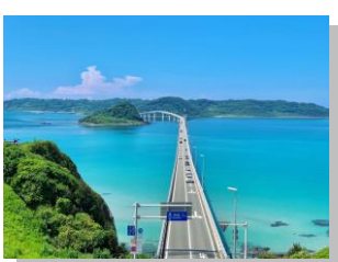
とてもキレイで大好きな角島の海 (2019年に撮影)

ただ、今は県を越えての移動はしないようにしていますので、地元の海でリフレッシュしています。