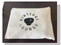
ステキな入れ物に入った金継ぎ道具たち♪

そんなある日、インスタグラムを見てみると「かんたん金継ぎセット」初心者でもOKの文字が目飛び込んできました！そしてすぐに購入しました！