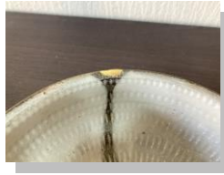
金継ぎ完成した器たち♪

作業はいたって簡単。ネーミングに偽りなしです(笑)。自分でいうのもなんですが、とっても不器用です、わたし。そんなわたしでも、この出来栄です。