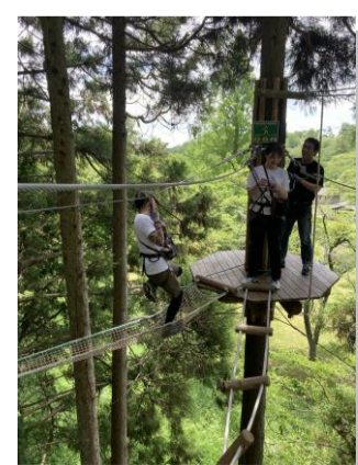
自然の樹木をつかったアトラクション♪