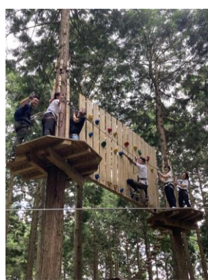
アトラクションも支えの木もけこう揺れます(-_-;)