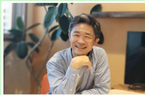
税理士法人TAパートナーズ代表