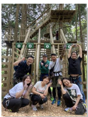
ひとりも欠けることなく、全コースまわりきりました!

4つのコースを回り終えるころには社長から「高いところ克服できたんじゃない?」と言われましたが、まだまだ無理そうでした。強行軍でしたが、とても楽しい一日でした♪