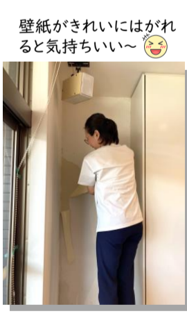
壁紙がきれいにはがれると気持ちいい~