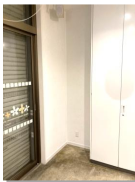
張替え完了! きれいになりました

壁紙の端は「コーキング剤」を使って処理することで、あら不思議、ガタガタだった壁紙の端も何事もなかったようにきれいに整えることができました。