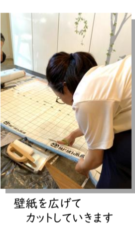
壁紙を広げてカットしていきます

次に、ネットで購入した「のり付き壁紙」を張り替えるために壁の長さより少し長めにカットした後、壁紙を張っていきます。