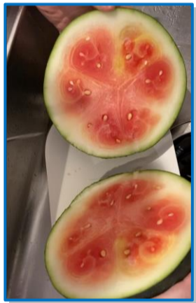
だいぶ早すぎた収穫...