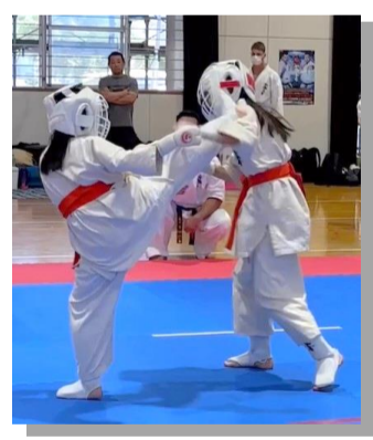
左:長女 右上段蹴りが見事に炸裂!

型と体力テストがおわり、いよいよ組手です。組手は一分。勝敗はありますが、負けても昇段はできます。ただ、一本勝ちをすると2つ昇段ができます。実はこれまでの昇段試験の組手はすべて一本負け。今回はどうかな...と夫婦各々スマホをにぎり組手開始。