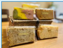
いろんな味が楽しめました♪