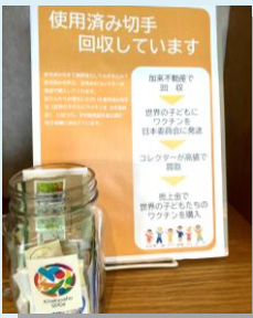
1枚からでもご協力ください