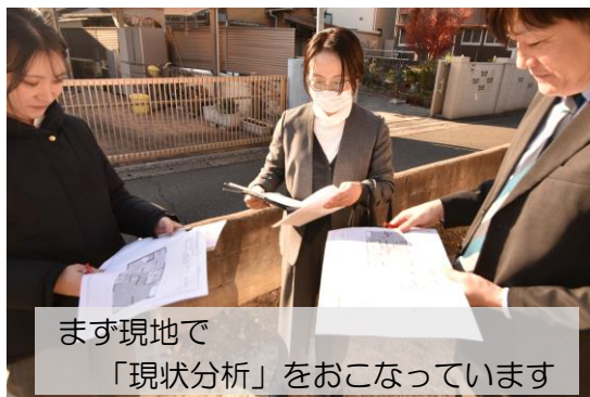
まず現地で 「現状分析」をおこなっています

空室・空き家化が社会問題になっていくなか、経済的で創造性あふれるアイデアを共有することで、競争力があり、住まい手に愛される賃貸物件を、そしてまちや地域を生み出していきます。