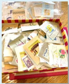
ご寄付いただいた使用済み切手