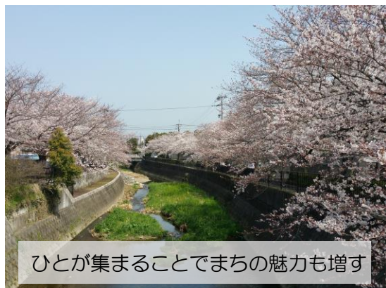
ひとが集まることでまちの魅力も増す