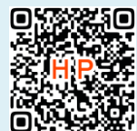
RAINBOWさんのホームページ

月1回おこなう全社ミーティングのおやつの時間。その名も「ほっこりTime♪」今回は、地元・守恒にお店があります「シフォンケーキのお店RAINBOW」さん(小倉南区守恒本町2-2-15)のシフォンケーキをみんなでモグモグ🍪 保存料・防腐剤・膨張剤を使わない無添加のシフォンケーキです♪プレーンやショコラや抹茶などの定番に加え、期間限定の桜シフォンケーキも🌸。とってもフワフワで美味しく、直前にお弁当を食べてお腹いっぱいのはずなのに、みんなでペロっいただきました。季節感も感じられて、ほっこりするひと時でした。