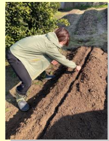
ニンジンの種まき♪