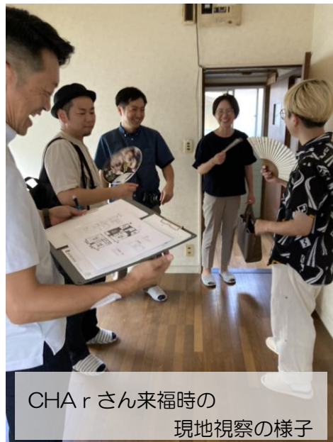
CHA rさん来福時の 現地視察の様子