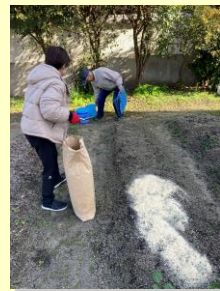
はたけに「ぬか」をまきました