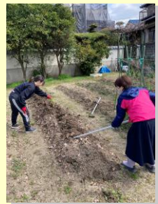
2度目のジャガイモの植込み