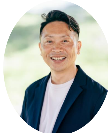
加来不動産株式会社 代表取締役