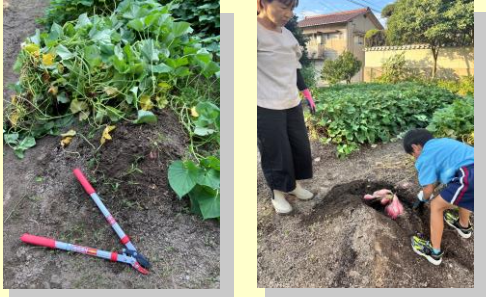
とても和む時間になりました♪

今回のサツマイモ掘りは、数回に分けておこないました。 「スタッフのお子さんにも体験してもらおう!」と計画し、事前に「ツル」を切り、お手伝いをしてもらいました😊 小さな子供と接する機会も少なかったこの頃、当日は一生懸命に取り組む姿や、近くにいた虫たちに興味津々な様子にいやされました♪ (西村 創)